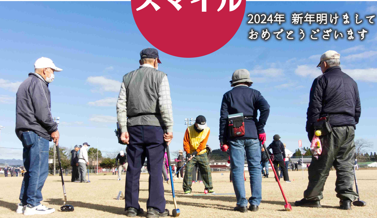
写真: 第16回ニコニコ杯グラウンドゴルフ大会 (2023年12月13日)