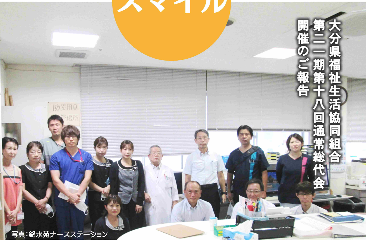
写真：銘水苑ナースステーション

当苑は、令和五年十二月十三日で開設三十周年を迎えます。利用者様、ご家族様、当初よりお力添えいただいた地域の皆様に厚く御礼申し上げます。 『相互扶助と自助・自立』 『最後まで人間としての尊厳を奪わない、失わせない』 当苑では、この基本理念のもと、医療・介護・リハビリテーションの各専門職種がきめ細かな連携を行い、利用者様の在宅復帰に向けたサービスを提供しています。 これから、初心を忘れることなく、スタッフ一同努力して参ります！